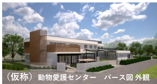
(仮称) 動物愛護センター パース図 外観