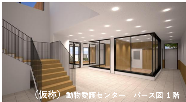
(仮称) 動物愛護センター パース図 1階

■ 保健福祉局長 譲渡促進を図るための、 馴化部屋の設置、ガラス越しに譲渡対象の猫を目にすることが出来る部屋をエントランスに配置 するほか、収容環境の改善として、犬猫の収容スペースの分離や空調設備の設置などを行う。 猫の収容頭数も拡充 するとともに、多頭飼育問題や災害時対応など、近年多様化する課題にも対応可能な設計としている。